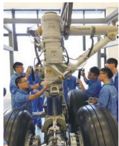
▲修讀飛機工程的學生透過太古飛躍翱翔工作體驗計劃接受工作體驗培訓

立了穩健持久的基礎，我們堅信香港定能從這場全球疫情危機中快速恢復元氣。我們熱切期盼「信望未來」計劃能為推動香港長遠發展作出貢獻。」